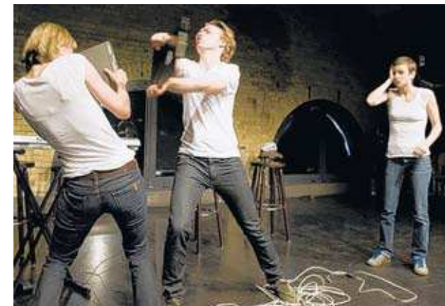
Auch in diesem Jahr zeigt die Stammzellformation das Erfolgsstück „Mamma Macchiato“.