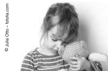
Treten bei Kindern regelmäßig ohne Ursache Schwellungen auf, kann eine Erbkrankheit dahinter stecken.

Juckende Schwellungen, zum Beispiel aufgrund eines Insektenstichs, sind völlig normal – das wissen Eltern. Treten allerdings immer wieder Schwellungen ohne erkennbare Ursache im Gesicht, an Armen oder Beinen bzw. kolikartige Bauchschmerzen auf, kann es sich auch um die seltene Erbkrankheit Hereditäres Angioödem (HAE) handeln, die einer ärztlichen Behandlung bedarf. Nicht alle Betroffenen haben die Erkrankung geerbt: Bei 20-25 Prozent der Patienten handelt es sich um Neumutationen ohne