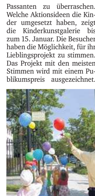
Die Kinder der Kita „Pustelblume“ ließen vor der japanischen Botschaft Ballons mit Kranichen steigen.

Prenzlauer Berg. In den vergangenen Wochen waren kleine Künstler an vielen Orten Berlins unterwegs. Mit Kunstaktionen entdeckten sie die Stadt. Passanten zu überraschen. Welche Aktionsideen die Kinder umgesetzt haben, zeigt die Kinderkunstgalerie bis zum 15. Januar. Die Besucher haben die Möglichkeit, für ihr Lieblingsprojekt zu stimmen. Das Projekt mit den meisten Stimmen wird mit einem Publikumspreis ausgezeichnet.